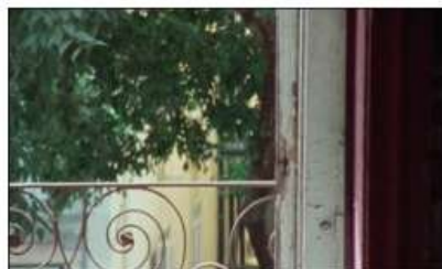
fotograma de "Onde Fica Esta Rua?

ou Sem Antes Nem Depois" (JPR+JRG), 00:08:21.