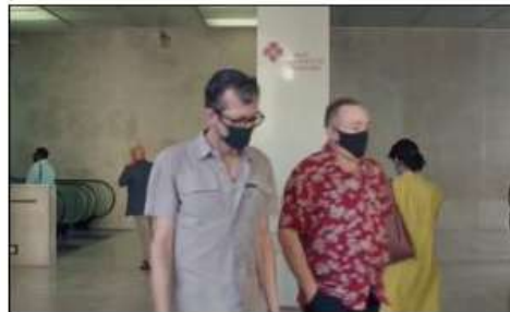
fotograma de "Onde Fica Esta Rua?

ou Sem Antes Nem Depois" (JPR+JRG), 00:08:21.