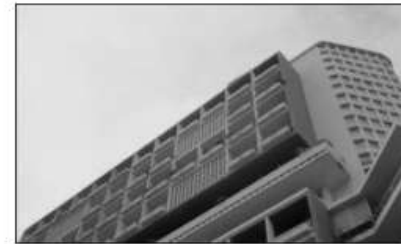
fotograma de "Onde Fica Esta Rua?