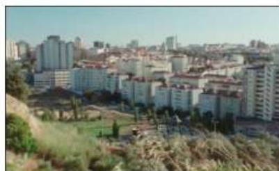
fotograma de "Onde Fica Esta Rua?