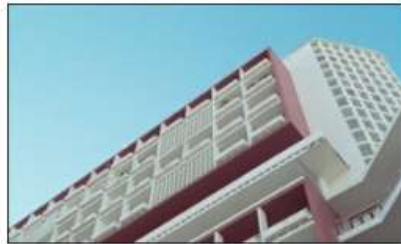
fotograma de "Onde Fica Esta Rua?