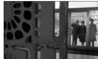
fotograma de "Onde Fica Esta Rua?