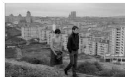
fotograma de "Onde Fica Esta Rua?