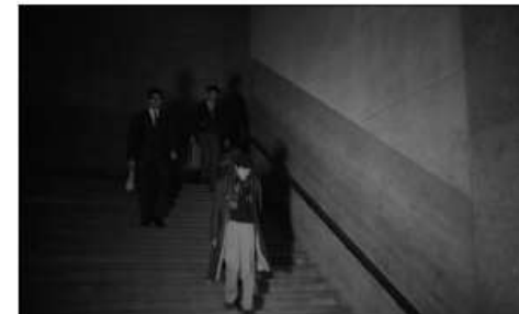
fotograma de "Onde Fica Esta Rua?

ou Sem Antes Nem Depois" (PR), 00:07:53.