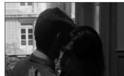
fotograma de "Onde Fica Esta Rua?

© Terratre Films, House on Fire, Filmes Fantasma, 2022.