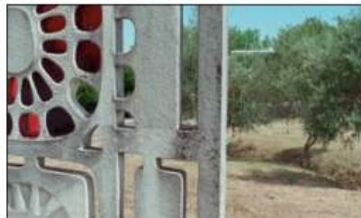
fotograma de "Onde Fica Esta Rua?