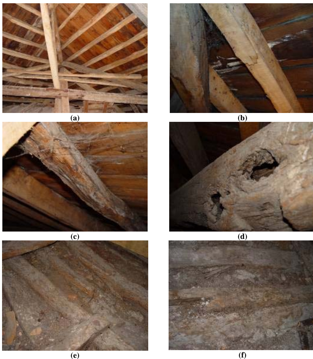
Figura 2 – Detalhes da cobertura existente: (a) complexidade do sistema estrutural; (b) presença de manchas de humidade; (c) deformação excessiva e podridão; (d) secção oca; (e, f) ataque generalizado das cambotas da abóbada principal

estrutura observado quer a nível visual, quer a nível estrutural. As entregas das vigas de suporte da estrutura nas paredes de alvenaria encontram-se em bom estado e alguns dos elementos de madeira do forro e do madeiramento geral da cobertura, não se apresentam em condições de continuar a desempenhar as suas funções, devido ao seu avançado estado de deterioração (2). Na Figura 2 apresentam-se algumas fotografias do interior da cobertura existente.