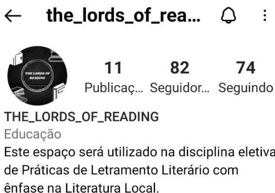
Figura 2: Apresentação da rede social do Instagram the_lords_of_reading - canal de divulgação das práticas letramentos com literaturas produzidas nas aulas da professora