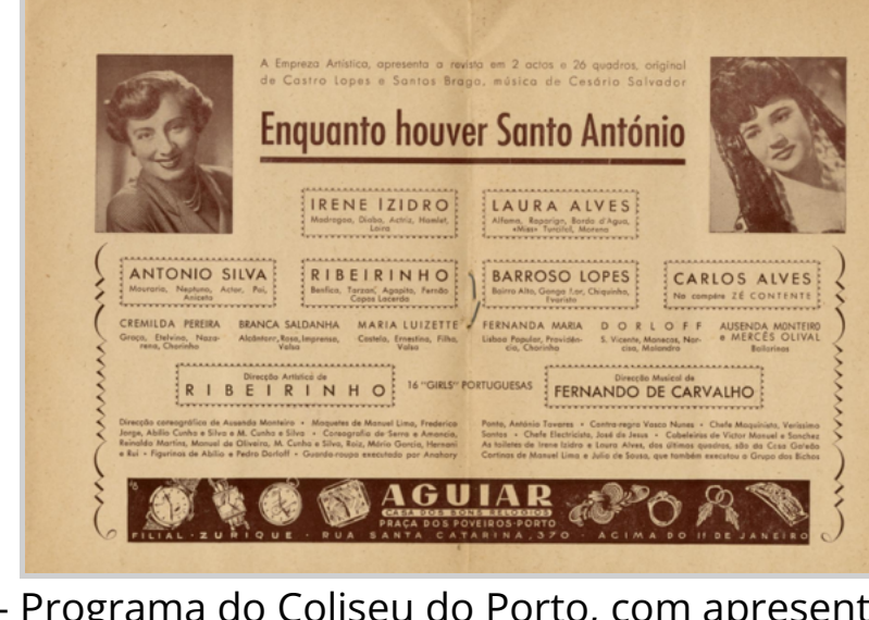
Fig.5 – Programa do Coliseu do Porto, com apresentação da revista «Enquanto houver Santo António». Inclui publicidade a produtos e estabelecimentos. Edições Belarte. [1950]