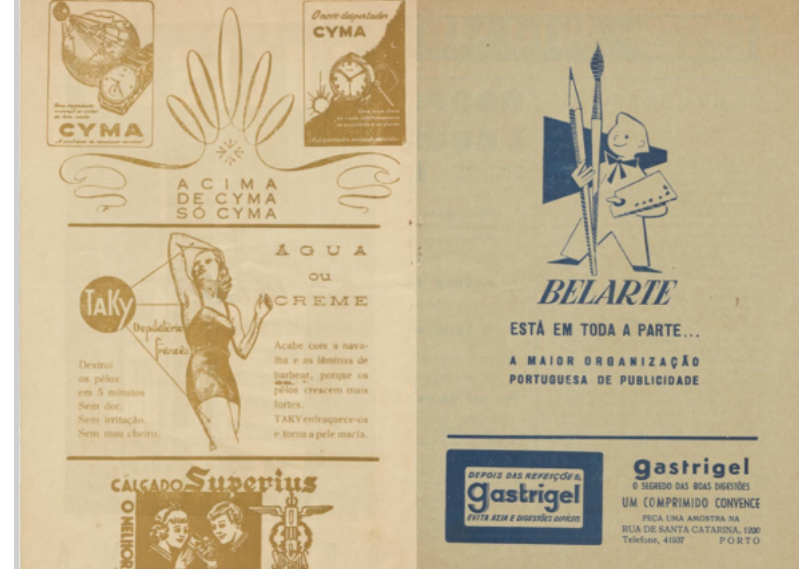
Fig. 8 – Programa do Coliseu, anunciando o filme A luva de ferro. Contém publicidade a produtos e firmas. 1953/9

Mas se há símbolos expressivos da estética de Cruz Caldas e, em simultâneo, da atividade do Coliseu do Porto, estes encontram-se nos cartazes dos bailes de Carnaval, pretexto para uma galeria de cor, movimento, luz e significado social. Neles, pontuam a luxúria do Cancan, palhaços (figura do Pierrot), máscaras, animais de circo e tipos sociais.