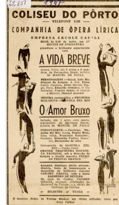
Fig. 6 – Notícia sobre os concertos de ópera no Coliseu, «A vida Breve» e «O Amor Bruxo», com pequenas ilustrações de Cruz Caldas. 1945

Misturando a sofisticação do novo espaço cultural com a sua desejada dimensão popular (o Coliseu é uma personagem, entre outras, da cidade) materializa esse ecletismo em alguns dos cartazes para o Carnaval do Coliseu. Assim acontece no exemplar em que uma multidão dançante invade a torre do edifício, ao mesmo tempo que uma máscara do Zé Povinho se instala na fachada. A modernidade popularucha do Coliseu é enunciada nas suas produções. Veja-se o "espetáculo moderno levado a efeito por jornalistas portuenses", cujo cartaz é da autoria de Cruz Caldas. Outras revistas passaram pelo lápis do publicitário ( Aleluia ), mas também óperas ( A Vida Breve e O Amor Bruxo ), a revista Enquanto Houver Santo António e espetáculos de circo. O Coliseu acumulava os bailes, concertos e teatro, com cinema, em nostálgicas matinéés e soirées .