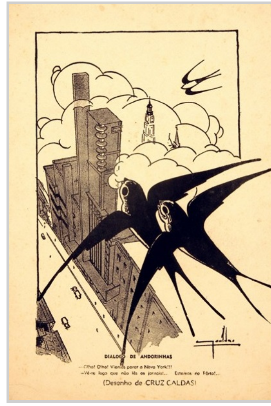
Fig. – 1 «O Primeiro de Janeiro» : diálogo de andorinhas [sobre o Coliseu do Porto], 1941

Em dezembro de 1941, duas andorinhas adiantavam estranhamente a Primavera sobrevoando a cidade do Porto. Confundida pelo cansaço da viagem ou pelo ar cosmopolita da cidade, uma delas exclamou: "Olha! Olha! Viemos para a Nova York!!!". A ilustração, da autoria do artista e publicitário António Cruz Caldas (1898-1975), foi publicada no diário local O Primeiro de Janeiro e anunciava a inauguração de um novo espaço na urbe: o Coliseu do Porto.