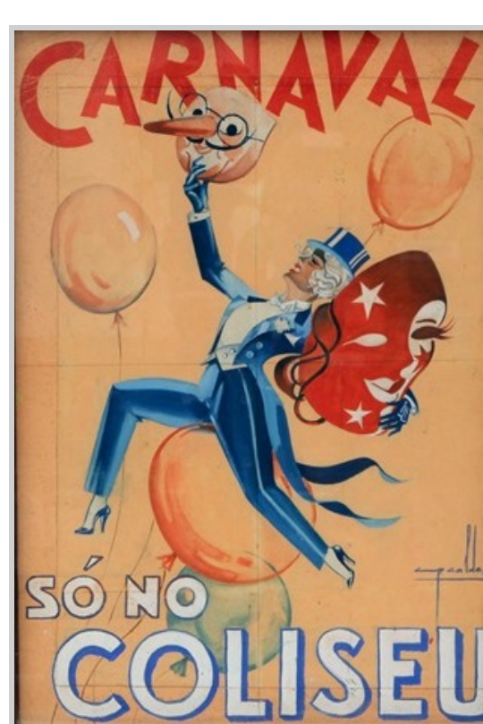
Fig. 10 – Desenho original de Cruz Caldas, para cartaz, encomendado pelo Teatro Circo Coliseu do Porto. 1958/01