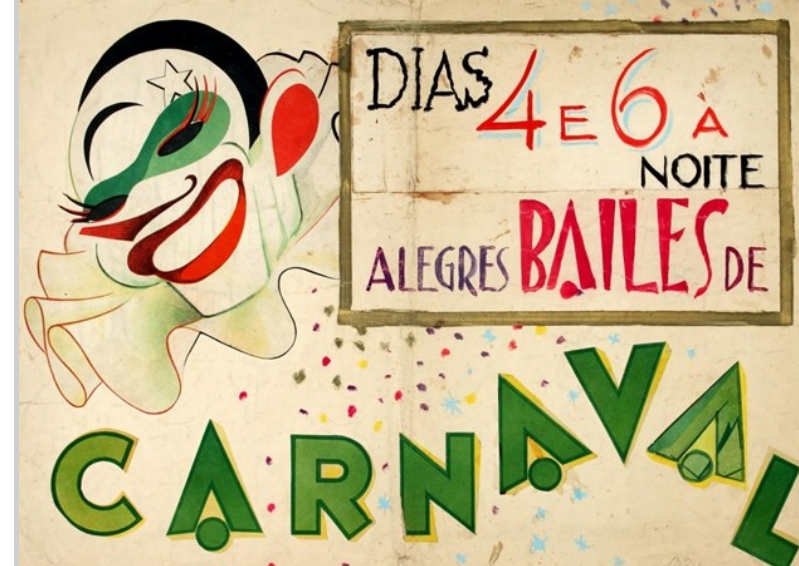
Fig. 11 – Estudo para um cartaz publicitário, alusivo ao Carnaval no Coliseu do Porto. Autoria do caricaturista e maquetista António Cruz Caldas. S.d.