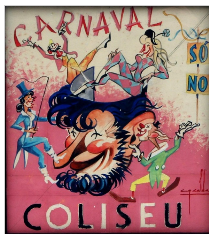
Fig. 9 – Desenho a guache encaixilhado para cartaz de carnaval. Por Cruz Caldas. S.d.

Mas se há símbolos expressivos da estética de Cruz Caldas e, em simultâneo, da atividade do Coliseu do Porto, estes encontram-se nos cartazes dos bailes de Carnaval, pretexto para uma galeria de cor, movimento, luz e significado social. Neles, pontuam a luxúria do Cancan, palhaços (figura do Pierrot), máscaras, animais de circo e tipos sociais.