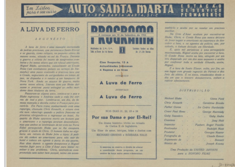
Fig. 7 – Programa do Coliseu, anunciando o filme A luva de ferro. Contém publicidade a produtos e firmas. 1953/9

Misturando a sofisticação do novo espaço cultural com a sua desejada dimensão popular (o Coliseu é uma personagem, entre outras, da cidade) materializa esse ecletismo em alguns dos cartazes para o Carnaval do Coliseu. Assim acontece no exemplar em que uma multidão dançante invade a torre do edifício, ao mesmo tempo que uma máscara do Zé Povinho se instala na fachada. A modernidade popularucha do Coliseu é enunciada nas suas produções. Veja-se o "espetáculo moderno levado a efeito por jornalistas portuenses", cujo cartaz é da autoria de Cruz Caldas. Outras revistas passaram pelo lápis do publicitário ( Aleluia ), mas também óperas ( A Vida Breve e O Amor Bruxo ), a revista Enquanto Houver Santo António e espetáculos de circo. O Coliseu acumulava os bailes, concertos e teatro, com cinema, em nostálgicas matinéés e soirées .