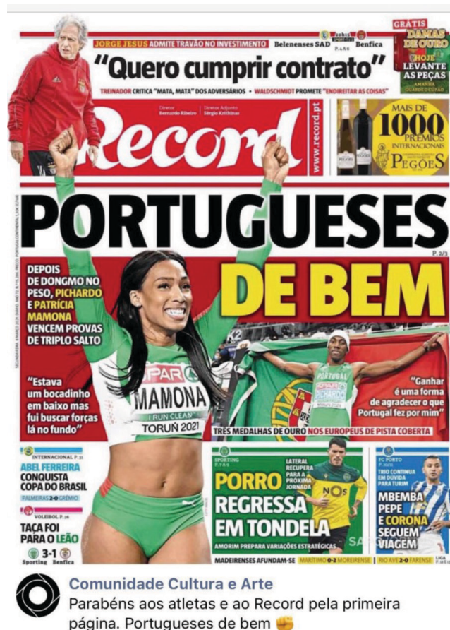
Figura 3. Publicação do Comunidade, Cultura e Arte (2021) sobre a capa do Record

da publicação da capa; o segundo apresenta Graça Fonseca, ministra da Cultura em funções à data da publicação da capa; o terceiro apresenta Manuel Luís Goucha, apresentador de televisão; o quarto apresenta Blaya, cantora, compositora e dançarina luso-brasileira; o quinto apresenta Diogo Infante, ator e cenógrafo; o sexto apresenta Ana Zanatti, atriz; o sétimo apresenta Adolfo Mesquita Nunes, político; e o oitavo apresenta Cláudio Ramos, apresentador de televisão. São todas estas pessoas conhecidas, celebridades que podem designar de tradicionais (Abidin, 2018), pois, mesmo tendo presença na Internet, obtiveram principalmente o seu reconhecimento pelos média ditos tradicionais. Homens e mulheres, géneros masculino e feminino e orientação sexual, segundo o jornal, “gays”. É de realçar o uso do termo ‘gay’ como conotativamente nem