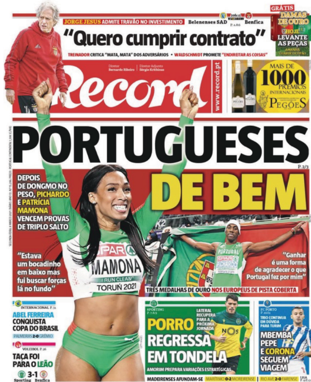
Figura 1. Capa do Record do dia 8 de março. Obtida através da publicação na página Facebook do jornal

sociossemiótica das capas (Kress e van Leeuwen, 2021; Mota-Ribeiro, 2011) e à Análise Crítica do Discurso (ACD) na sequência das capas e focada nas publicações das redes sociais (Carvalho, 2008; Pinto-Coelho, 2008). Numa abordagem interpretativa, a primeira baseia-se na “gramática visual” de Kress e van Leeuwen (2021), que ambiciona pôr em evidência sentidos de forma por menorizada das estruturas visuais. Já a segunda ambiciona pôr em evidência o que explícita e implicitamente produzem e reproduzem em termos de discursos, visando analisar isto com um olhar crítico, indo interpretativamente além daquilo que é o objeto e oferecendo uma reflexão crítica sobre a visualidade gerada pelas capas e o que representam as celebridades nelas incluídas. Para a primeira, esclarece-se que os componentes funcionam entre si como um todo unido. São eles: o representacional,