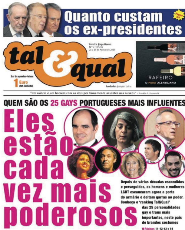
Figura 2. Capa do Tal&Qual do dia 24 de agosto de 2021. Obtida através da publicação na página Facebook do jornal

determinados objetivos por parte do jornal, até pela motivação das vendas associadas ao poder que a capa tem (Burrowes, 2014).