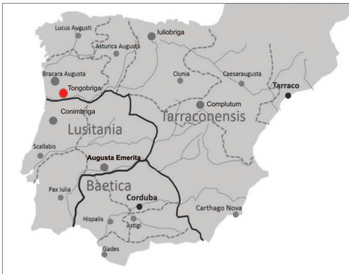
Fig. 1: Mapa com a distribuição administrativa da Hispânia e localização de Tongobriga .

Em Tongobriga , as zonas conhecidas que oferecem exemplares de casas de tipologia romana situam-se na área mais alta do povoado, onde se assinala um processo evolutivo contínuo em relação às habitações circulares pré-romanas, que são arrasadas e substituídas por construções em que domina a linha reta, nas quais se aprecia a presença do léxico arquitetónico itálico. Entre as novas construções desenham-se espaços de circulação, cuja orientação escapa à malha ortogonal de ruas que vem sendo proposta para a fase fundacional da cidade, no pressuposto de que terá existido um planeamento prévio, ainda que