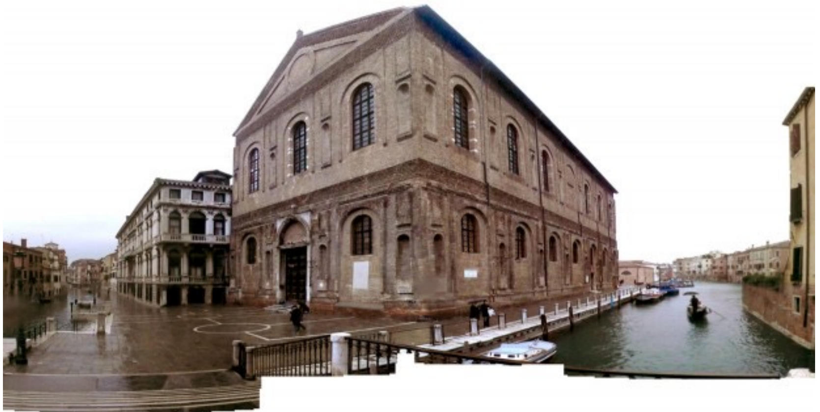
Em Veneza, as confrarias tomavam o nome de “scuole”. Na imagem, a Scuola Grande della Misericórdia