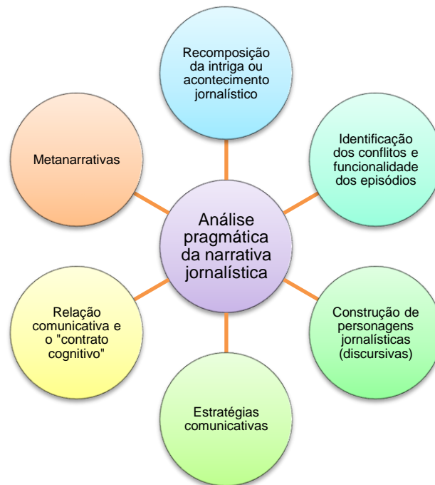
Fig. 3. Sem ordem pré-estabelecida, a única exigência da análise pragmática da narrativa jornalística é a exposição dos seis movimentos.