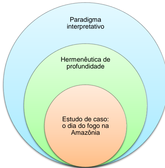
Fig. 1. Apreensão teórico-metodológica da investigação.

De maneira breve, indica-se que a análise sócio-histórica se dividiu em três instâncias. Primeiro, observou-se que o caso evidenciou o debate em torno da Amazônia não apenas como fonte de biodiversidade, mas principalmente como fronteira socioeconômica, uma vez que, mundialmente, prevalece a ideia de preservação para a sobrevivência do planeta Terra; nacionalmente, a floresta importa como área de expansão do povoamento e da economia brasileira a fim de garantir a soberania sobre o território; e, regionalmente, as elites procuram superar o “atraso” para se igualar às sociedades modernas (Dutra, 1999; Paes Loureiro, 1995). Em seguida, refletiu-se sobre a capacidade mediadora do jornalismo, ou seja, de relacionar o mundo da vida e o mundo do texto ao narrar os fenômenos percebidos, reconstituindo-os de modo singular por meio de um discurso específico (Freitas & Benetti, 2017). Por fim, caracterizaram-se os jornais Folha de S. Paulo e Público a partir de certos indicadores, como a trajetória de crescimento desde a fundação, a circulação impressa e digital, bem como os princípios do manual de redação e estilo. Por ter-se escolhido as narrativas jornalísticas para a observação e análise do dia do fogo na Amazônia, destaca-se, a seguir, o movimento do discurso em direção à configuração narrativa.