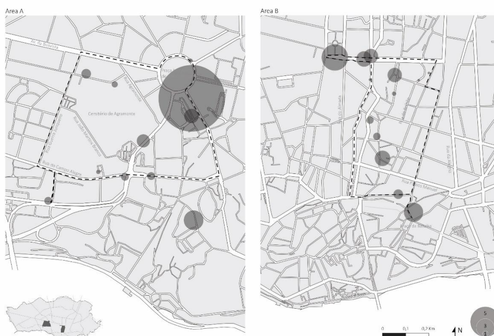
Figura 2: Caminhadas de exploração e número de pessoas em situação de sem abrigo

realizadas nas áreas A e B, foi possível definir dois percursos pedonais principais, tal como referido. Este processo permitiu adquirir uma ideia precisa dos locais e do número de pessoas em situação de sem teto, ao longo de ambas as rotas (Fig. 2). À exceção da rua Júlio Dinis, onde oito grandes entradas de edifícios e lojas acolhiam em média 10 pessoas em situação de sem teto, todos os outros locais tinham em média 1 a 4 pessoas. Muitos destes locais tinham espaço apenas para uma pessoa, e na maioria das situações, os locais eram limpos meticulosamente antes de serem usados, às vezes com água e vassouras.