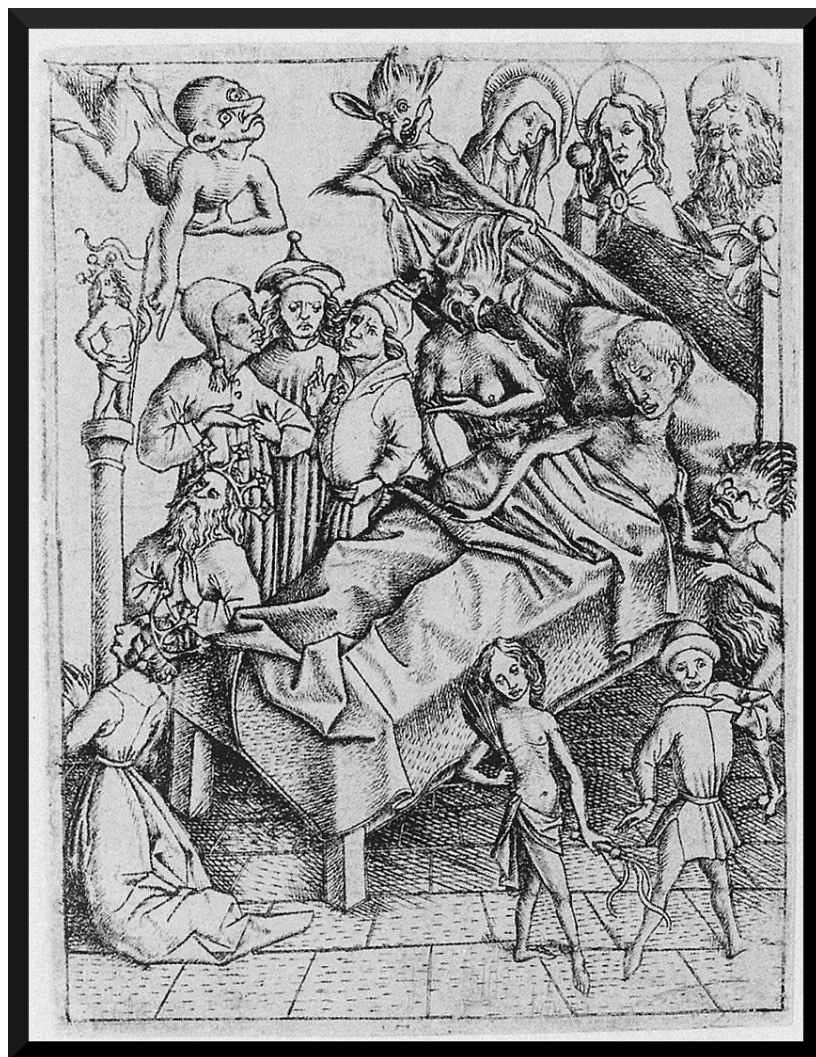
Figura 5. Mestre E. S. Ars moriendi , Tentação da Fé, c. 1450.

Historicamente, o último suspiro era o mais importante, o culminar da vida. Assim o estipulavam os livros, medievais e modernos, dedicados à ars moriendi . Receava-se morrer em combate ou por acidente, porque se comprometia a passagem (Ariès, 1977). O ideal era morrer no leito, rodeado pela família, pelos amigos e pelos anjos e demónios, que disputavam, na derradeira prova, a alma do defunto (ver figura 5). Hoje, a partida, a travessia, é cada vez mais solitária e cada vez mais expedita (Elias, 2002). Como se o rio de Caronte tivesse perdido as margens.