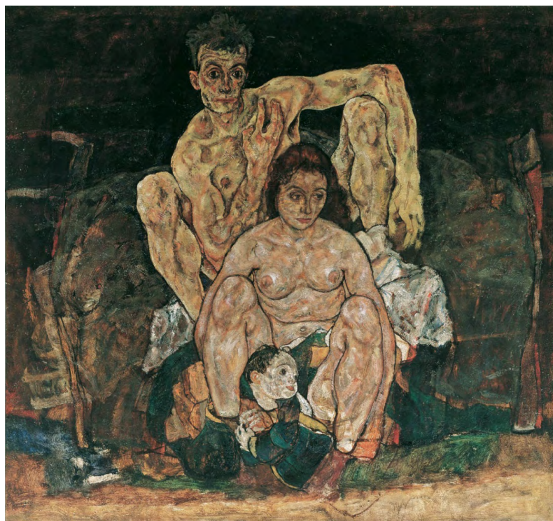
Figura 1. Reprodução da pintura, A Família de Egon Schiele.

vertente da influência sobre as estruturas sociais ou sobre a dimensão individual do quotidiano, atualmente é consensual o reconhecimento da sua interferência sob o ponto de vista social e cultural. Assim, é inegável que as doenças afetaram as civilizações de diversas formas, não apenas a nível demográfico, mas também a nível social, político, económico e cultural. A arte e a literatura constituem importantes veículos, ainda que menos óbvios, para estudar o(s) impacto(s) que tiveram ao longo do tempo. Foram bloqueadoras de atividade e motivos de inspiração, influenciadoras de contextos mais otimistas ou pessimistas, condicionando movimentos e fazendo do corpo instrumento de comunicação. Paradigmático deste aspeto, e até premonitório, é o quadro do pintor austríaco Egon Schiele, A Família , que remete para uma família (a sua) que não se concretiza pela morte da esposa e, três dias depois, do seu próprio falecimento, vitimado pela pneumónica. Esta epidemia teve o condão de fechar ciclos, antecipar mudanças e estimular a adoção de novos hábitos e comportamentos, como a prática desportiva e as atividades de lazer ao ar livre. Porém, como afirma J. N. Hays (2009), há uma relação entre as civilizações e as doenças. São múltiplas as doenças e as circunstâncias históricas que atestam esta relação bilateral.