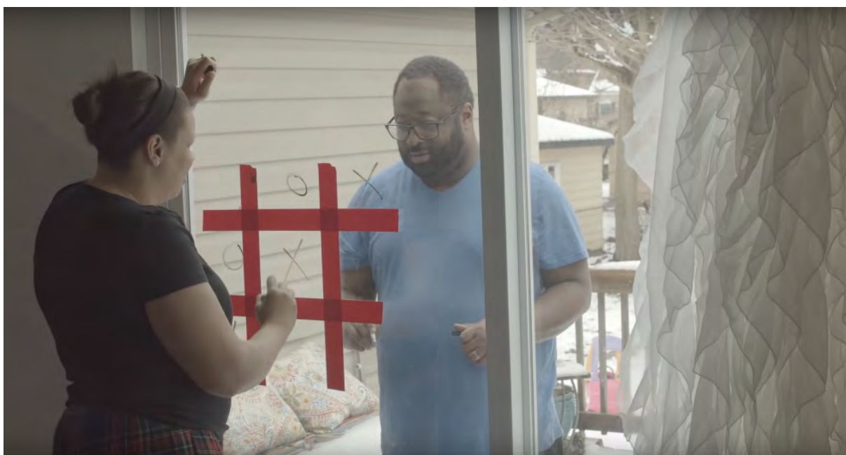
Figura 2. Jack Daniel's. With love, Jack! Energy BBDO. Estados-Unidos, março 2020.

Na parte final, surge a frase: “Dear Humanity / Cheers to making social distancing / social. / With love, / Jack”.