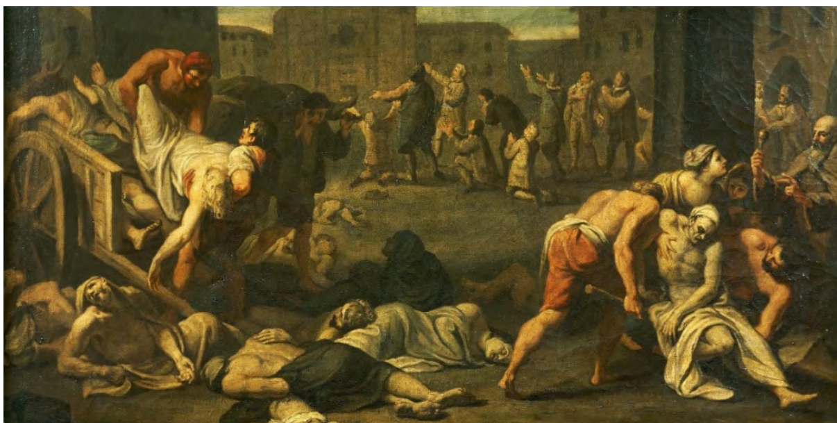
Figura 3. Ilustração da peste em Itália, no século XVII. Museo Storico Nazionale Dell'Arte Sanitaria.

se amontoavam nas ruas e nas casas (ver figura 3). Tamponar os orifícios naturais, trânsito da vida (Bakhtin, 1987), embrulhar o corpo em duas embalagens de plástico e transportá-lo em caixão fechado representa um zelo tecnicamente justificável. Tragicamente, não dispomos de outra solução, senão isolar e desinfetar. Não obstante, este zelo cinzela a nossa identidade. A cultura dos povos revela-se na sua relação com os mortos (Thomas, 1988). A múmia expressa o Egipto Antigo; o transi , a Idade Média; a fotografia post mortem , a era vitoriana; o holocausto, o século XX; e o embrulho em duplo saco plástico, o início do terceiro milénio. Há fenómenos aparentemente acessórios que se apoderam, simbolicamente, da imagem global. Recordo a farda dos médicos durante a peste negra (ver figura 4).