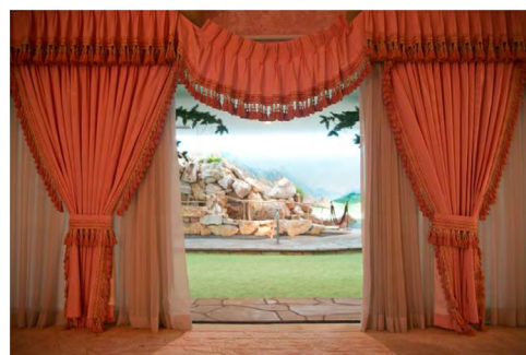
Bunker em Las Vegas (1970) projeto de Girard B. “Jerry” Henderson.