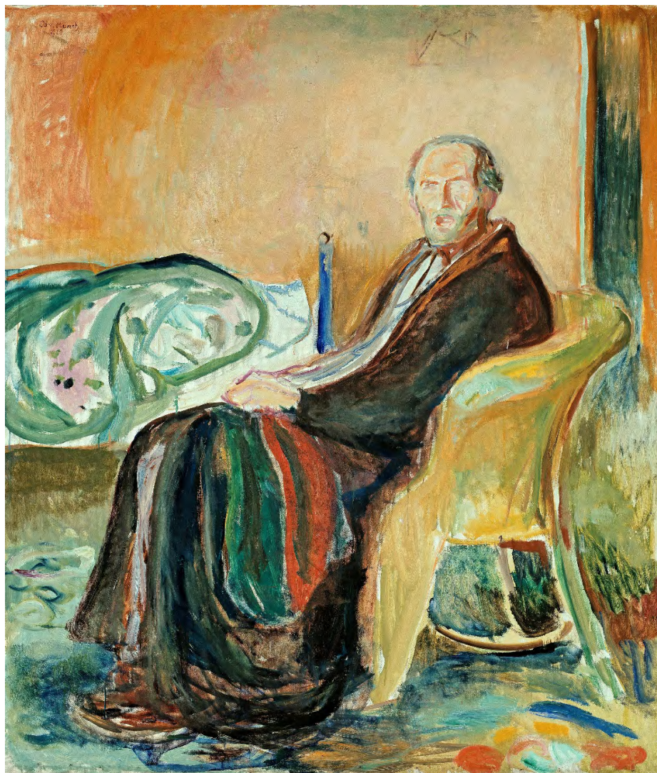
Figura 2. Reprodução do Autorretrato depois da gripe espanhola (1919) de Edvard Munch.

Se algumas doenças causavam repulsa e medo, pelos sintomas que exibiam e pela degradação que causavam, como a cólera, que aterrorizou os europeus no século XIX, outras assumiram uma aura romântica, inspirando óperas, peças de teatro e obras literárias, como foi o caso da tuberculose (Snowden, 2020). A dor e a angústia motivadas pelas epidemias tendem, contudo, a ser distintas das advindas das doenças endêmicas ou crônicas. Os seus efeitos são mais devastadores, mesmo em países mais desenvolvidos e sua história é longa. Estão longe de ser uma ameaça controlada ou longínqua, dado que vários fatores contribuem, no tempo corrente, para a sua recorrência, nomeadamente as alterações climáticas, o crescimento demográfico, a globalização e a