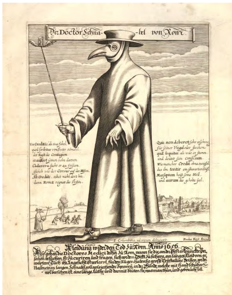
Figura 4. Paulus Furst. Gravura do Dr. Schnabel de Roma. Equipamento de médico durante a peste negra. 1656.

Ao isolamento dos cadáveres, somou-se a interdição de visitas a hospitais e lares de idosos. Uma conjugação fértil em situações estranhas. As pessoas “despedem-se”, quando têm oportunidade, de familiares e amigos ainda vivos, dias ou semanas antes do óbito. Caso contrário, nem vivo, nem morto. Ninguém adivinha. Abre-se um novo mundo. A vida encolhe-se numa morte social (Thomas, 1979). Apaga-se sem familiares, sem amigos, sem sentido e sem dor. A ausência de despedida e os “cuidados com o cadáver” não se reduzem a meros procedimentos objetivos; são falhas no mundo da vida, são enxertos anómalos no imaginário. É a potência da fragilidade.