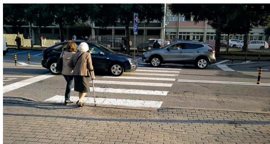
Figura 1 ▶ Automobilistas que não param perante a presença dos peões na travessia pedonal

Além disso, tendem a não olhar para ambos os lados da estrada, ou a não aguardar que os automobilistas parem. Os idosos atravessam normalmente em marcha rápida, mas, por norma, aguardam a paragem dos automóveis, aproveitando para fazer acenos de agradecimento aos automobilistas. A observação permite estabelecer algumas conclusões acerca dos automobilistas e sobre as formas como abordam as travessias. Tal como as imagens demonstram, há condutores que não param, mesmo avistando o peão. Num total de 2726 atravessamentos observados, os carros, em 2639 dos casos, em vez de pararem, só abrandaram. Observa-se, aliás, e com regularidade, que há carros a pararem sobre a travessia (Figura 2).