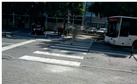
Figura 4 ▶ Criança a correr durante o atravessamento