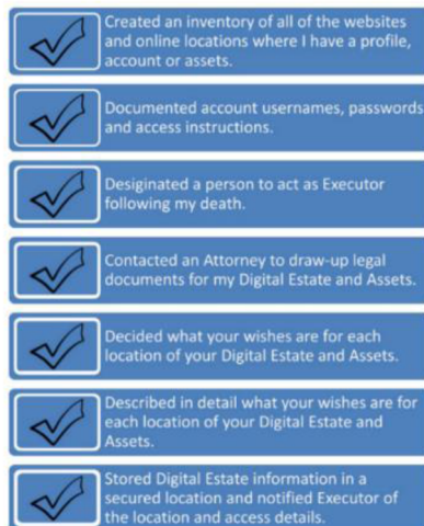
Figura 2 – Check List: Planeamento para Herança Digital (adaptado de [5]).