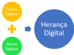
Figura 1 – Ingredientes da Herança Digital

possam existir, tendo em conta o fato da tecnologia se desenvolver rapidamente.