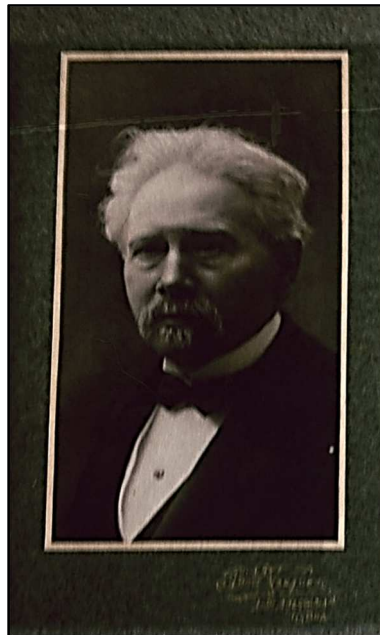
Figura 3 – Fotografia oferecida por Teófilo Braga a Júlia Cunha em 21 de Outubro de 1923.

Em Janeiro de 1924, a relação chega à prevista cessação com a morte de Teófilo Braga. Em Fevereiro, constitui-se a Comissão Teófilo Braga (Pacheco (1924), pp. 99-100), que, prontamente, endereça convites para colaboração num volume de preito ao Mestre.