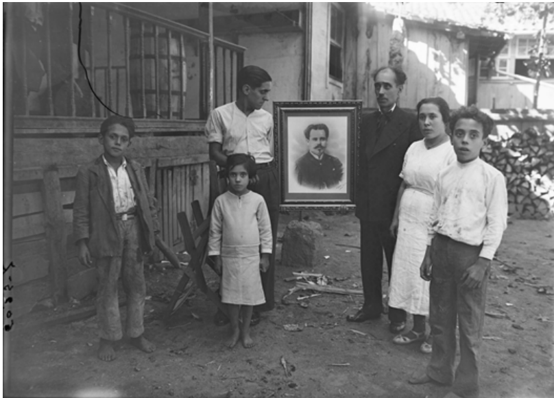
Figura 4: Família Exterior, sem data. (Ref. AAL2249)