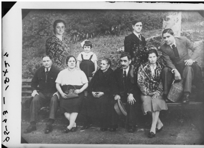
Figura 6. Fotomontagem, S. Paio de Merelim – Braga, 1949, © Museu da Imagem, Arquivo da Fotografia Aliança (Ref. AAL1223)