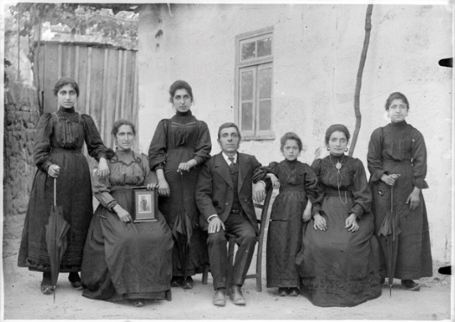
Figura 3: Família em espaço rural, Décadas de 1890/1910, Local Não identificado, Fotógrafo Desconhecido. © Coleção Fotografia Muralha. Associação para a Defesa do Património de Guimarães