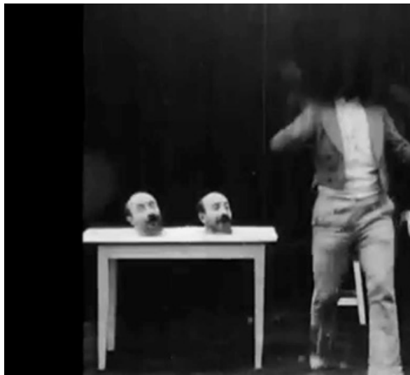
Figura 9. Frame do filme Un homme de têtes (1898) realizado por George Méliès