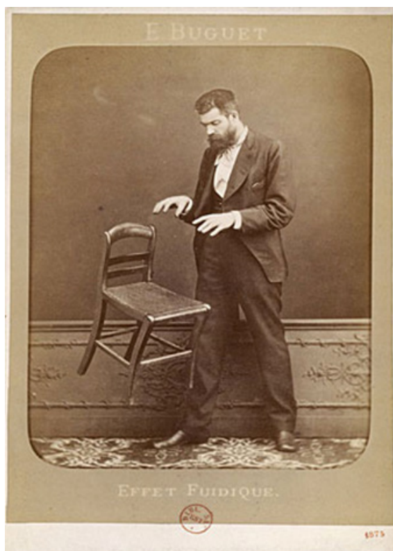
Figura 7. Efeito Fluídico , Edouard Buguet, 1875, The Metropolitan Museum, Wikimedia Commons, Domínio Público