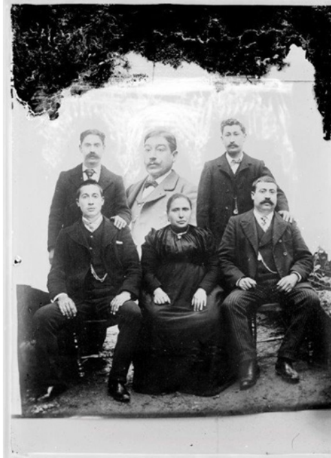
Figura 5: Fotomontagem sobre retrato de família, Início do séc. XX, Local Não identificado, Fotógrafo Desconhecido. © Coleção Fotografia Muralha. Associação para a Defesa do Património de Guimarães