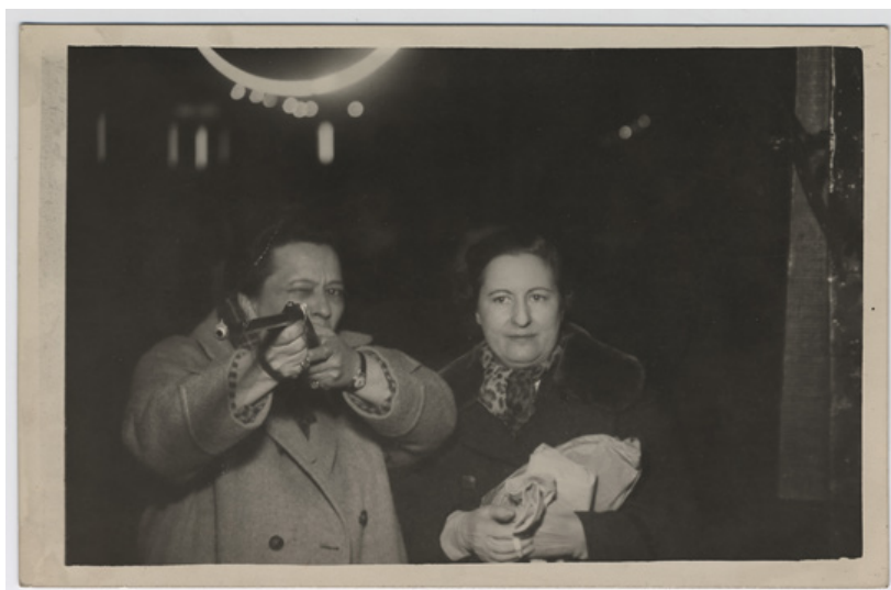
Figura 10: Anónimo, Postal Tiro Fotográfico. Foire du Trône, 5 de abril de 1959.