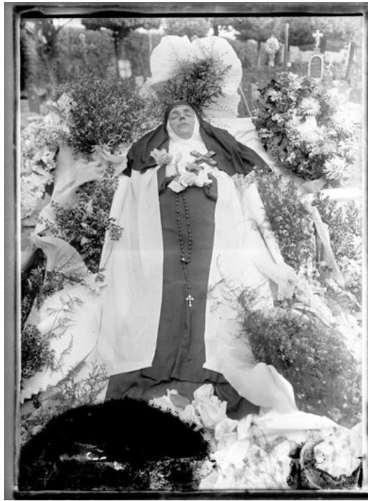
Figura 1: Fotografia Postmortem de Freira.