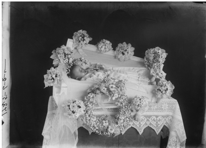
Figura 2: Fotografia Postmortem de Criança, 1911. © Museu da Imagem, Arquivo da Fotografia Aliança (Ref. AAL2854). Arquivo da Photographia Aliança. Museu da Imagem