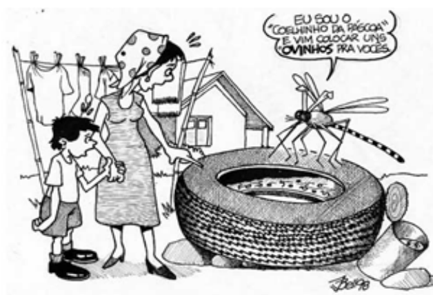
Figura 1. Charge sobre a dengue

A Charge a ser analisada foi retirada da internet, mais precisamente em um blog denominado Cardápio Pedagógico ( http://cardapiopedagogico.blogspot.pt/ ), que propunha algumas atividades a serem desenvolvidas com alunos sobre diversos temas dentre eles a dengue (Figura 1).