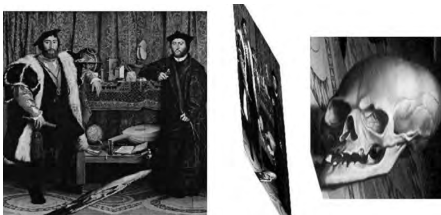
Figura 9: Hans Holbein, Os Embaixadores , 1533

Por falar em quadros, Os Embaixadores (1533) de Hans Holbein é uma obra que nos desafia. É um mistério cheio de segredos. O quadro não só versa sobre uma intriga como está, ele próprio, organizado como um enigma. Não identifica as personagens: não se sabe quem são, nem o que fazem, nem de onde vêm. Mas o quadro contém todas as chaves necessárias à descoberta. Omar Calabrese dedica um longo texto à análise sistemática desta obra (Calabrese, 1997: 35-68). No que nos diz respeito, vamos focalizar-nos apenas no efeito mais célebre da composição: a anamorfose. Se observarmos o quadro (Figura 9), a nossa atenção é atraída por uma forma anómala, uma mancha de tamanho apreciável, em baixo, ao centro. Erro ou desleixo são hipóteses que não condizem com Holbein, um dos mestres mais meticolosos de toda a história da pintura. De facto, aquela mancha configura uma anamorfose: contemplada de um certo ângulo, assume a forma de uma caveira, de uma vanitas (Figura 9). Artimanhas da perspectiva. O certo é que esta ilusão representa uma pista primordial para o acesso à verdade do quadro Os Embaixadores , para a sua correcta interpretação.