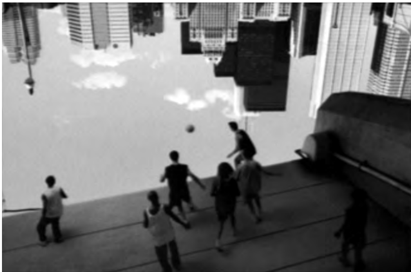
Figura 13: Upside down , Peugeot, 2001

(Kerckhove, 1997: 38). Mexem connosco e, sobretudo, conduzem-nos a experienciar o impossível. Eis a principal razão para o tamanho do quadro ter que ser maior do que o tamanho do mundo. Para pintar, além das paisagens e das histórias previstas por Alberti, o sonho e o impossível.