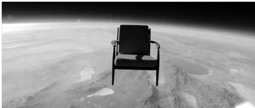
Figura 1: Space chair , Toshiba, 2009

tenta esmagar automóveis Peugeot 6 ou aqueloutro que pesca homens utilizando um Renault Clio como isco 7 , não deixam de lembrar o bom Gargântua a roubar os sinos da catedral de Notre-Dame de Paris. Mas o gigante que nos torna míopes é aquele em que estamos embarcados: o nosso planeta. Seria despropositado traçar uma lista dos anúncios que mostram a Terra fotografada ou filmada do espaço. Vamos cingir-nos a uma publicidade recente da Toshiba ( Space chair 8 ): uma cadeira, suspensa num balão, munida com oito câmaras, filma, à medida que sobe, o planeta Terra. O slogan da versão portuguesa é particularmente sugestivo: “inovar é ver como ninguém viu”. “Ver como ninguém viu”, porventura mais do que ver “o nunca visto”, eis a tentação ou, melhor, a proposta que percorre a publicidade actual.