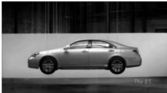
Figura 11: Perspective , Lexus, 2008