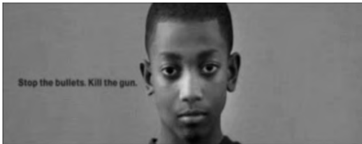
Figura 4: Stop The Bullet , Choice FM Radio, 2007

Os anúncios Burst 28 , da Schweppes (Figura 3), e Ballet 29 , da NFL Company in USA, contam-se entre aqueles em que o efeito estético da câmara lenta mais sobressai, a partir de motivos deveras simples: no primeiro, a explosão, em vários cenários, de balões cheios de água; no segundo, um bailado com dois jogadores de futebol americano. Mas o anúncio que combina de forma exímia estética e mensagem é, certamente, o Stop The Bullet 30 , da Choice FM Radio (Figura 4). Mantendo o enquadramento e a trajectória, balas fazem explodir, um após outro, vários objectos colocados sempre na mesma posição: um ovo, um copo com leite, uma maçã, uma embalagem de ketchup, uma garrafa de água, uma melancia. Por último, aparece a cabeça de uma criança, mas, em vez da bala, surgem as letras: Stop the bullets. Kill the gun.