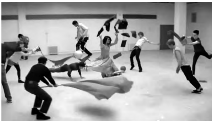
Figura 7: Time Sculpture , Toshiba, 2008

Velocidade normal, retardamento, retrocesso, imobilização, looping . E se um único anúncio contemplasse, simultaneamente, todos estes movimentos? Qual seria o resultado? Caos ou beleza?