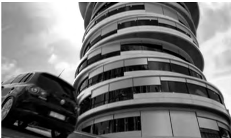
Figura 14: Moving City , Volkswagen, 2007

Outro automóvel avança numa cidade onde nada permanece estável: tudo se move, tudo se transforma, como se fosse construída com legos hiperactivos. Alteram-se os prédios, as casas, os pavimentos, as garagens... Como diria Pascal (1998:38), não há “fundamento fixo” onde se firmar. Tudo é movimento. “A cidade nunca descansa”. E, no entanto, o carro prossegue, impávido, a sua rota até ao destino (Figura 14). O anúncio é da Volkswagen e chama-se Moving City 60 .