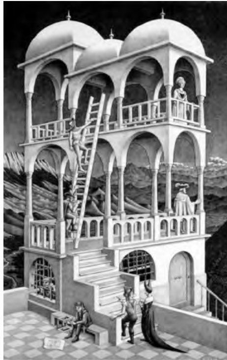
Figura 10: M. C. Escher, Belveder , 1958

Retornemos ao anúncio Perspective da Lexus. O carro pára no ponto em que se gera a ilusão. Um ser em pedaços mostra-se inteiro. Suspenso no ar, parece, agora, integrar um plano bidimensional. Parado, elevado, estampado, a posar para a eternidade, faz lembrar um ícone da arte (copta, bizantina, pop art ou outra). Estes traços configuram uma representação que se situa nos antípodas da perspectiva.