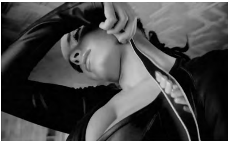
Figura 18: Look what's inside , Unilever, 2007

Estes dois anúncios propõem-nos duas leituras distintas da fragmentação, que, sublinhe-se, não implica necessariamente alienação. Em Look what's inside , deparamo-nos com uma coleção de mulheres; em Recette d'une femme mode , com uma mulher plural. Esta última, pode não saber exactamente quem é, nem conseguir regressar ao núcleo da sua individualidade, o “não sei quê” que talha a identidade e o “quase nada” que faz toda a diferença (Jankélévitch, 1980). Tropeça, mesmo assim, no nome e na carne. Este texto já vai longo e quanto mais se expande mais se assemelha a um mosaico do Gaudi no Parque Güell. Urge encontrar um par de chaves para o fechar.