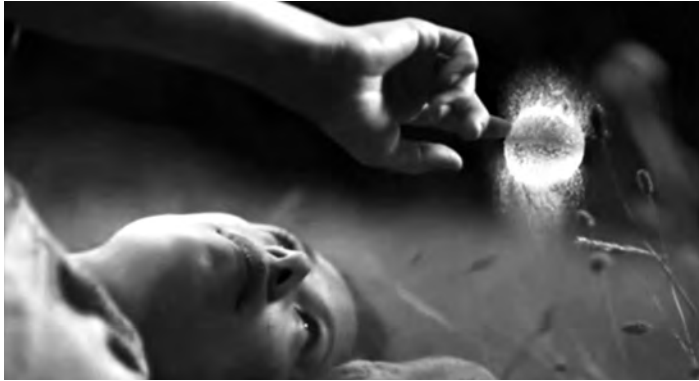
Figura 3: Burst , Schweppes, 2008

Os anúncios Burst 28 , da Schweppes (Figura 3), e Ballet 29 , da NFL Company in USA, contam-se entre aqueles em que o efeito estético da câmara lenta mais sobressai, a partir de motivos deveras simples: no primeiro, a explosão, em vários cenários, de balões cheios de água; no segundo, um bailado com dois jogadores de futebol americano. Mas o anúncio que combina de forma exímia estética e mensagem é, certamente, o Stop The Bullet 30 , da Choice FM Radio (Figura 4). Mantendo o enquadramento e a trajectória, balas fazem explodir, um após outro, vários objectos colocados sempre na mesma posição: um ovo, um copo com leite, uma maçã, uma embalagem de ketchup, uma garrafa de água, uma melancia. Por último, aparece a cabeça de uma criança, mas, em vez da bala, surgem as letras: Stop the bullets. Kill the gun.