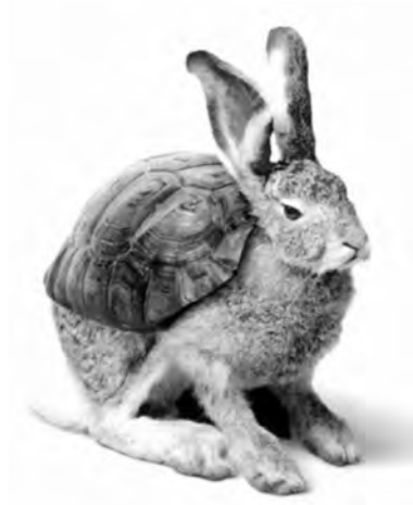
Figura 5: Hale/Tortoise , Volkswagen, 2002

No anúncio Fountain 36 , da Audi, coabitam duas configurações espaço-temporais: uma, acelerada e a outra, retardada. Numa estrada de montanha, um automóvel pisa um lençol de água provocando um jacto que se precipita em câmara lenta; entretanto, o carro desce a encosta a alta velocidade e estaciona; após um compasso de espera, a água cai, sempre em câmara lenta e com belo efeito, sobre o automóvel. Embora opostas, as duas configurações espaço-temporais não se limitam a coexistir, também interagem.