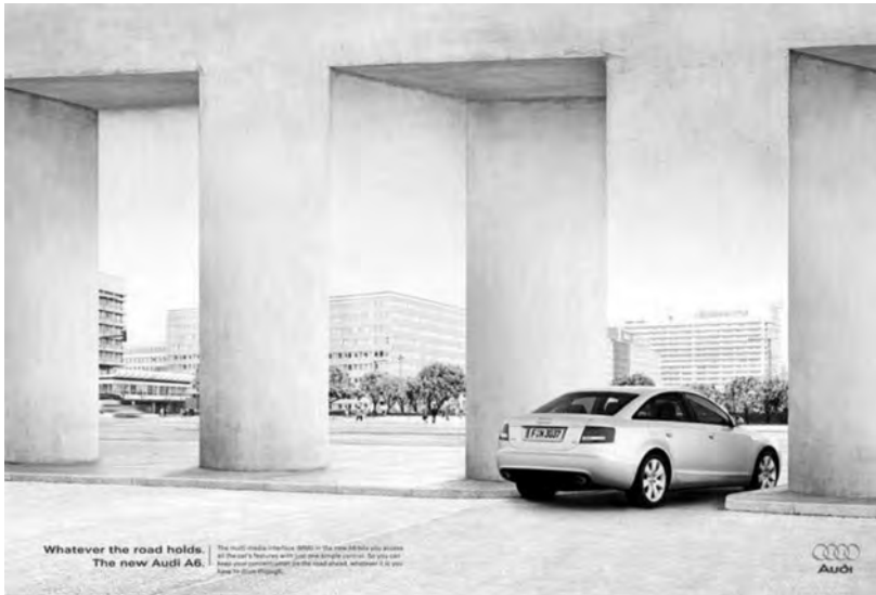
Figura 12: Illusions , Audi A6, 2004 ( Outdoor )