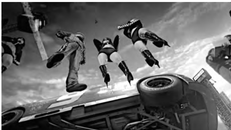
Figura 8: Underground , Fox Sports Marketing, 2009

metros de profundidade. Com a garantia de se ver como nunca antes ninguém viu. O fenómeno lembra a Professora Frizadinha a levar os seus alunos aos sítios mais inacessíveis a bordo da “Carrinha Mágica”, numa série de animação para crianças da autoria de Joanna Cole e Bruce Degen, estreada em 1994. É certo que, graças às sondas, às endoscopias, às ecografias, às webcams e às nanotecnologias, nunca estivemos tão perto de embarcar numa “carrinha mágica”, de preferência toda envidraçada como as cabines da London Eye.