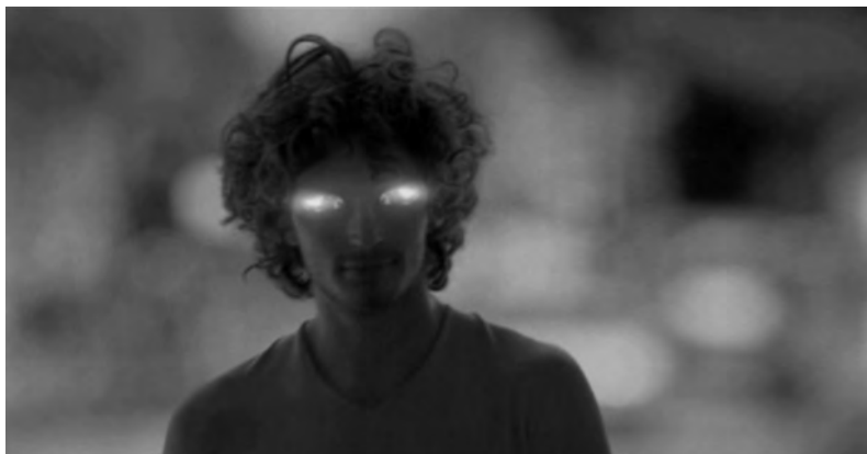
Figura 16: Evolution , Renault, 2006

Este procedimento resulta bastante vulgar no imaginário contemporâneo, que, aliás, caracteriza. Não surpreende, portanto, o sucesso granjeado na área da publicidade. Não só as coisas se transformam em figuras humanas (por exemplo, o Bibendum , o Homem da Michelin, criado em 1898) como, proeza que Arcimboldo não ousou conceber, seres humanos se transformam em coisas (por exemplo, nos anúncios Evolution 62 , da Renault, e Human car 63 , da Ford, um jovem e um grupo de bailarinos transformam-se em carros).