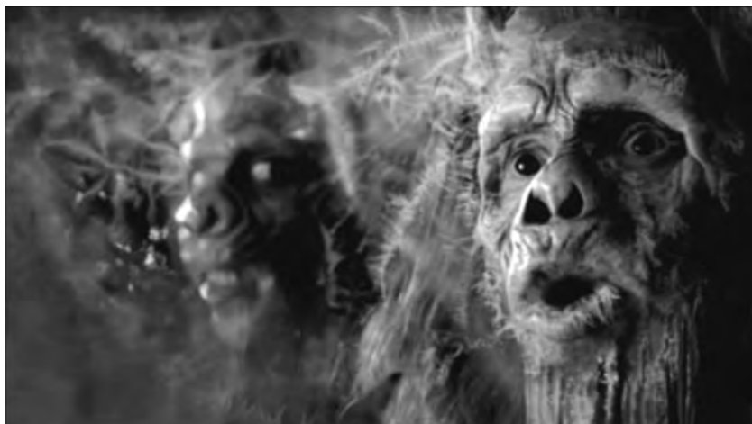
Figura 6: noitulovE (Evolution) , Guinness, 2006

No segundo anúncio, Past Experience , da Heineken 40 , um homem sai para comprar cerveja. Durante a viagem de táxi, tudo muda: os prédios, as ruas, os carros, as pessoas... Entra num bar do século XIX onde, surpreendentemente, o sabor da cerveja continua “exactamente o mesmo”: “ Heineken unchanged since 1873 ”. Neste anúncio, o passado e o presente reforçam-se mutuamente: contra ventos e marés, a Heineken manteve-se inalterável; nasceu perfeita e assim continuará.