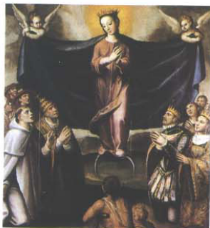
A representação da Virgem de Misericórdia (Lisboa) projecta as desigualdades sociais do período moderno: intercessora dos pecadores junto de Cristo seu filho, protege todos sob o seu manto, nobres, clero e, relegados para um pequeno espaço, os pobres, onde se incluem as crianças.