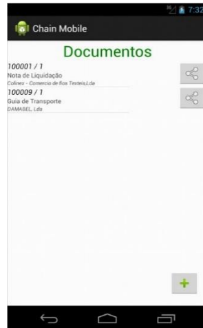
Figura 2 - Menu Documentos (GUI)