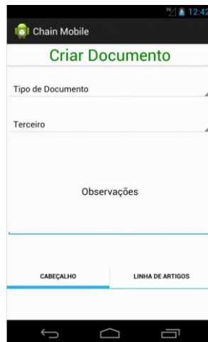
Figura 3 - Menu Criar Documento - Tab1 (GUI)