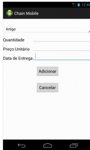
Figura 5 - Menu Adicionar Linha ao Documento