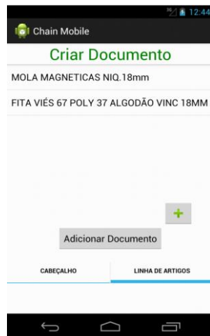
Figura 4 - Menu Criar Documento - Tab2 (GUI)