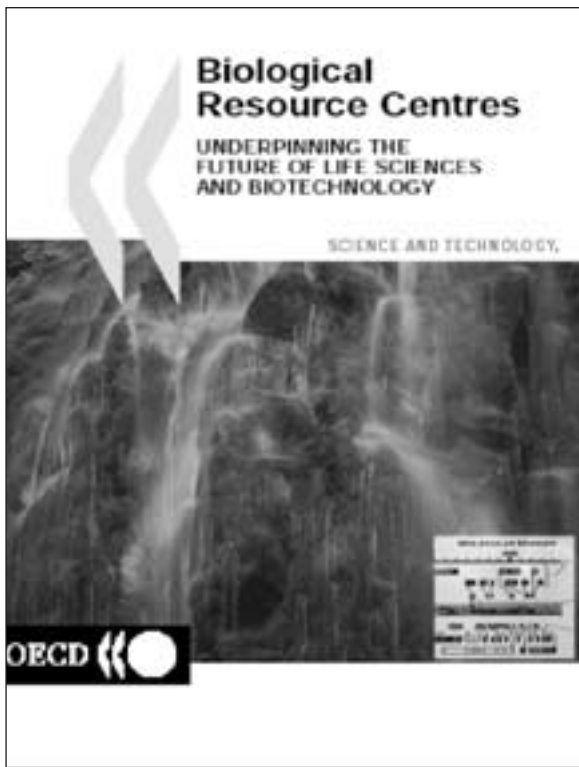
Figura 1: Relatório da OCDE sobre BRCs.

O conceito BRCs – Biological Resource Centres foi lançado nos fins dos anos 40, do século passado, pela UNESCO-MIRCEN. Em 1998, o Japão tomou a iniciativa de propor à Organização para a Cooperação e o Desenvolvimento Económico (OCDE 5 ) o estudo dos Centros de Recursos Biológicos como elementos-chave da infra-estrutura científica e tecnológica para as ciências da vida e biotecnologia. Como resultado deste esforço, em Fevereiro de 1999, realizou-se em Tóquio um workshop da OCDE dedicado às infra-estruturas científicas e tecnológicas para apoiarem os BRCs. Passados 2 anos desta iniciativa, em 2001, foi publicado o relatório (Fig. 1): Biological Resource Centres – Underpinning the Future of Life Sciences and Biotechnology 6 .