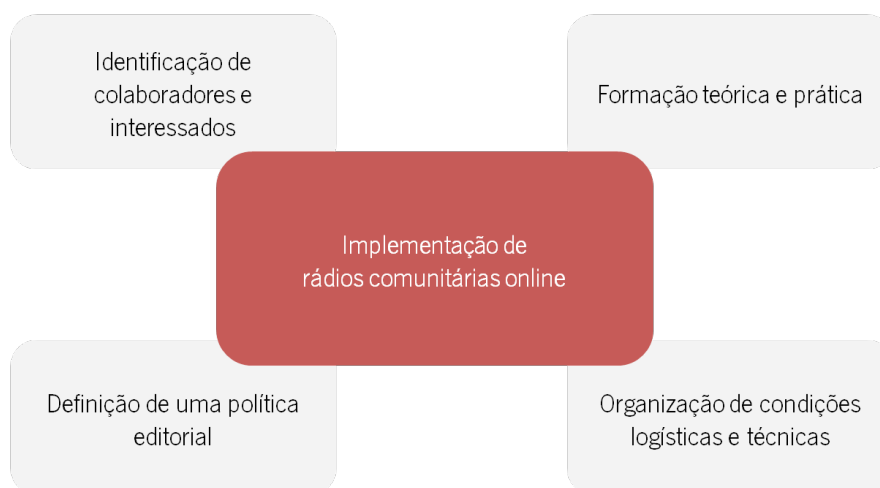
Figura 1 - Áreas de atuação da proposta de implementação de rádios comunitárias online

O objetivo principal desta proposta consistirá na criação de rádios autossuficientes e geridas autonomamente pelos cidadãos, levando à antena conteúdos considerados relevantes para a vida pública. No fundo, esta proposta inspira-se num dos três princípios defendidos pela União Europeia no Horizonte 2020, particularmente nos ‘desafios sociais’, que relacionam a implementação de tecnologias e plataformas inovadoras de comunicação com a promoção do bem-estar das populações, num quadro de rentabilidade sociocultural. A complementaridade entre áreas científicas, outra das recomendações deste plano, também se concretiza nesta ideia.