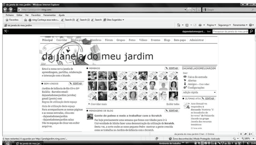
Figura 1 – Aspecto parcial da rede social da janela do meu jardim

A emergência de novos paradigmas de aprendizagem coloca-nos um desafio que já não se confina a um espaço unicamente limitado à interação de crianças-educador, mas antes que promova habilidades e literacias no uso dos artefactos tecnológicos, com a participação e colaboração de toda a comunidade educativa. É neste contexto que, em 2007, surge a criação da plataforma, no endereço < http://janelajardim.ning.com >. O seu aparecimento justificava-se, por um lado pela necessidade de responder aos desafios da Sociedade de Informação e, por outro, para responder à integração das TIC em contexto de Jardim de infância. Pretende ser não uma solução, mas uma resposta, um caminho possível para a integração das tecnologias no Jardim de infância de Rio Côvo Santa Eulália - Barcelos, bem como potenciar uma maior aproximação e interação entre todos os membros da comunidade educativa.