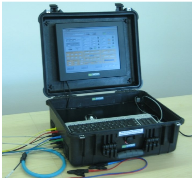
Figura 1 – Monitorizador de QEE desenvolvido pelo GEPE no Projeto SINUS (versão portátil).

O protótipo posterior foi desenvolvido no âmbito do Projeto SINUS [1]. Relativamente à primeira versão, foram melhoradas as características relativas ao peso e dimensões de todo o sistema com vista a facilitar a portabilidade. Ao nível do software foram desenvolvidas novas aplicações e melhoradas as existentes (Figura 1).