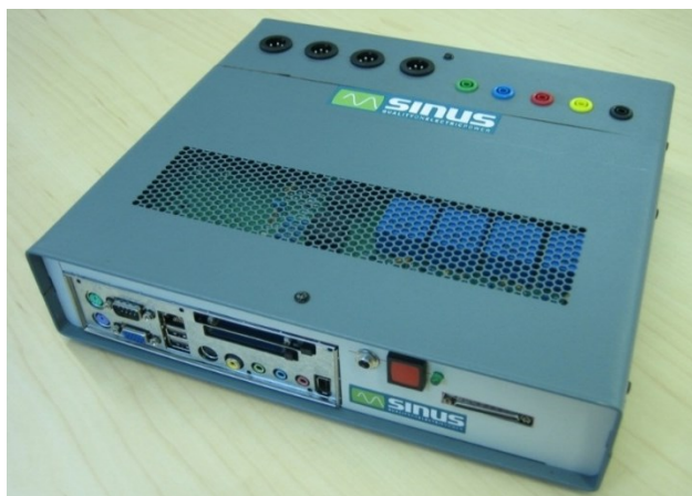
Figura 2 – Monitorizador de QEE desenvolvido pelo GEPE no Projeto SINUS (versão para aplicação fixa).

Foi também desenvolvida uma variante para utilização fixa no interior de um quadro elétrico, que no âmbito do projeto foi embutida num Filtro Ativo de Potência do tipo Paralelo com vista a demonstrar o funcionamento desse equipamento.