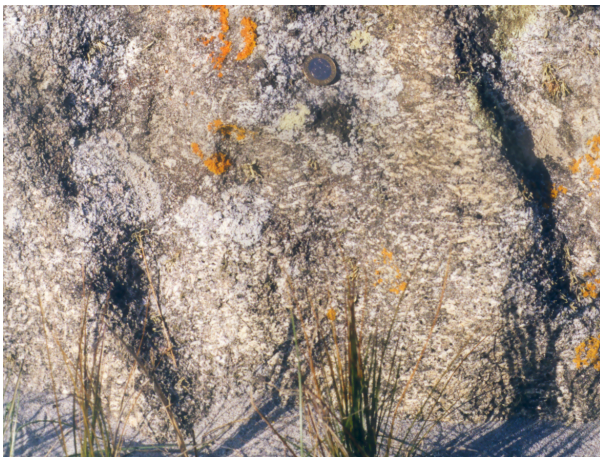
Figura.3- Fluidalidades do plutonito de Bouça de Frade (p).