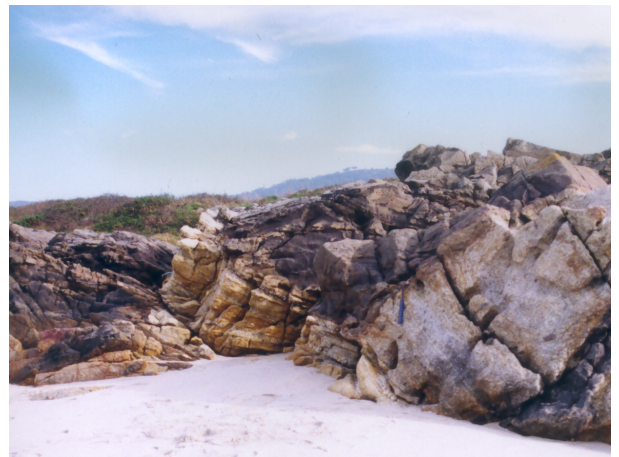
Figura.4- Instalação magmática resultante de migração difusa () de magma. p / metassedimento.