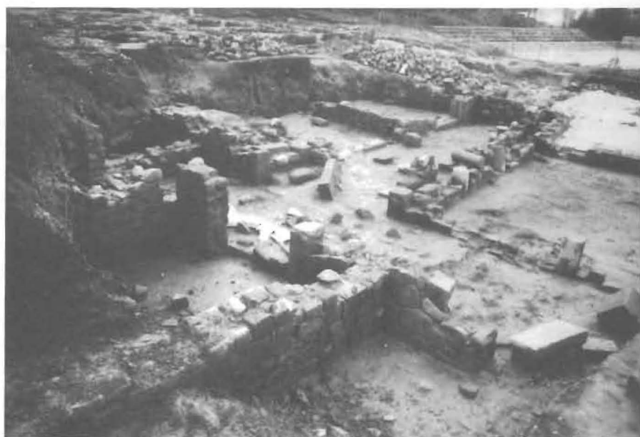
2. Perspectiva das Carvalheiras