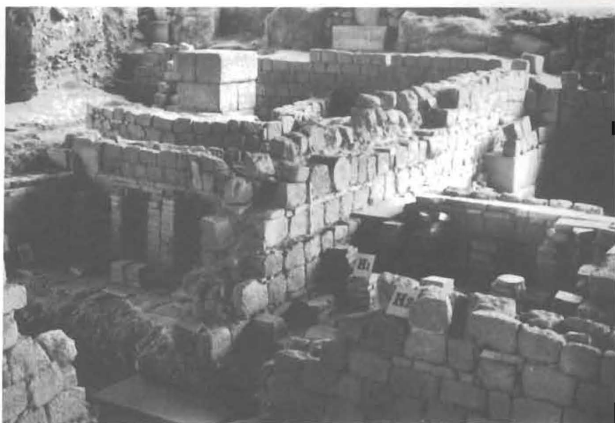
1. Perspectiva das termas do Alto da Cividade