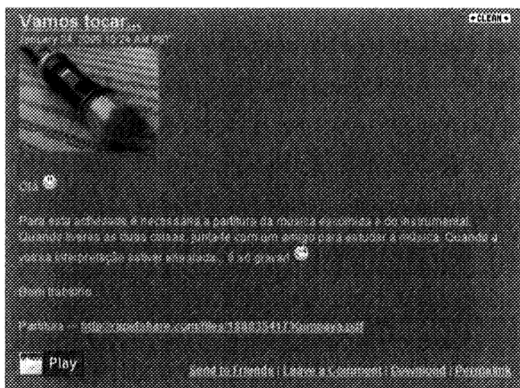
Figura 4. Actividade “Vamos tocar...”

O grau de dificuldade elevado desta actividade reflectiu-se no baixo nível de participação da turma: apenas quatro alunos apresentaram a sua interpretação.