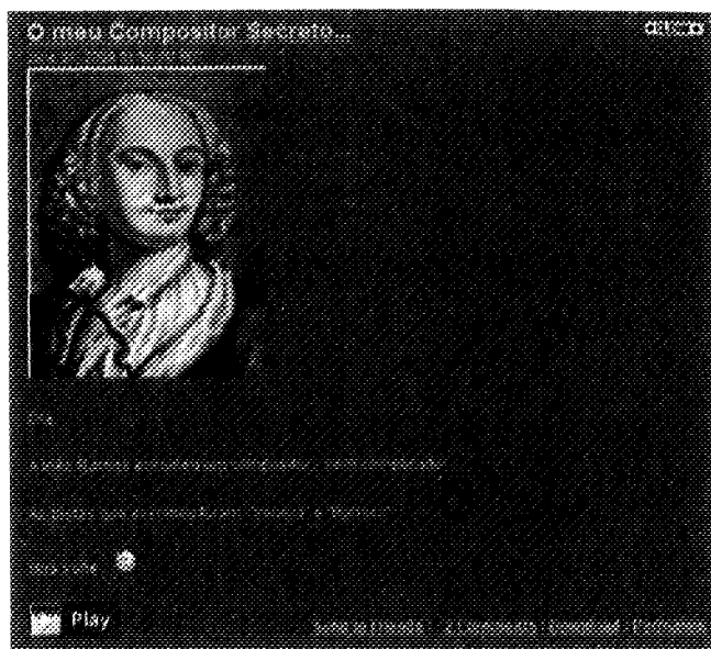
Figura 6. Actividade “O meu Compositor Secreto”

De um modo geral, os compositores escolhidos pelos alunos não eram muito fáceis de descobrir, tendo os alunos manifestado uma preferência clara por compositores actuais.