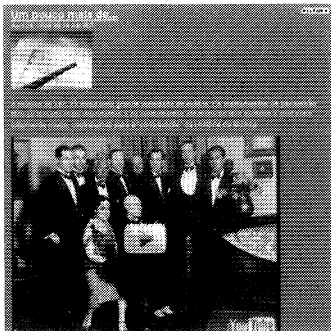
Figura 5. Actividade “Um pouco mais de...”

Como a actividade “Compositor Secreto” teve um interesse e participação elevada, resolvemos criar uma nova actividade – “O Meu Compositor Secreto” (Figura 6). Esta actividade não estava prevista inicialmente, mas, como se tratava de um estudo no qual o plano metodológico é flexível, foi possível adaptá-lo à realidade concreta da pesquisa.