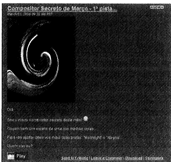
Figura 2. Actividade “Compositor Secreto”

De um modo geral, todos os participantes conseguiram descobrir qual o compositor secreto; uns logo na primeira pista, outros precisaram de pistas subseqüentes para corrigir a resposta. Isto foi observado quer na primeira fase, quer na segunda fase desta actividade. Também é importante realçar que outros alunos da escola, para além da turma responsável pelo podcast , participaram nesta actividade.