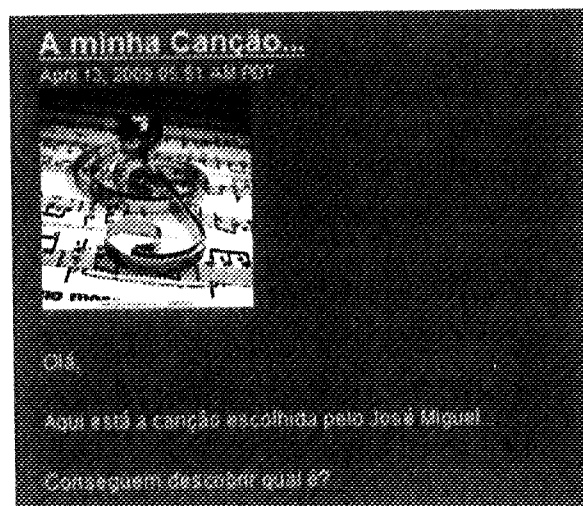
Figura 3. Actividade “A minha Canção...”

Nesta actividade, presumivelmente porque foi disponibilizada numa altura complicada para os alunos (final do período) não obtivemos uma participação tão elevada como nas actividades anteriores. Também observámos um maior interesse dos alunos da turma na descoberta da canção escolhida pelos colegas, do que na criação da sua própria canção.