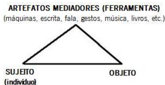
Figura 2: Relação mediada do sujeito com o meio ambiente (Daniels, 2003)

como foco as actividades desenvolvidas pelo ser humano no seio social. Estas actividades são mediatizadas pelo uso das tecnologias que emergem das próprias necessidades dentro de um contexto sócio, político e cultural. Por isso, são consideradas como veículos da experiência social e do conhecimento científico sujeitas a transformações ao longo da história (ver figura 2), a que Vygotsky alude como relação de mediação entre o indivíduo e o ambiente.