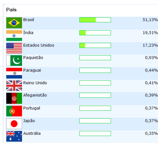
Gráfico 1: Distribuição dos 10 países que mais utilizam a rede social Orkut iv .

Possui hoje mais de 1.200,00 (um milhão e duzentos mil) utilizadores registados. Este quantitativo possui uma representação mais significativa em apenas 10 países (ver gráfico 1), como sejam: Brasil (51,13%), Índia (19,51%), Estados Unidos (17,23%), Paquistão (0,93%), Paraguai (0,44%), Reino Unido (0,41%), Afeganistão (0,39%), Japão e Portugal (0,37%) e Austrália (0,35%).